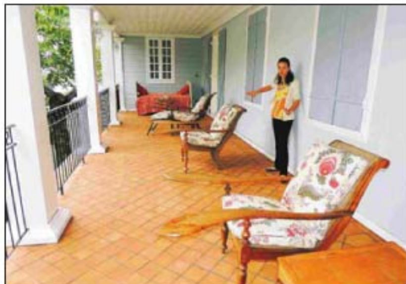
Les très rares fauteuils-plantier sur la terrasse arrière.